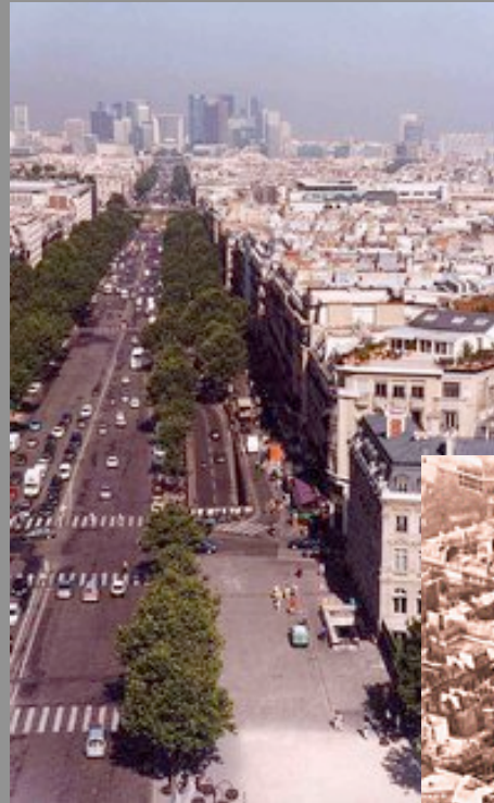
Avenue de la Grande Armée