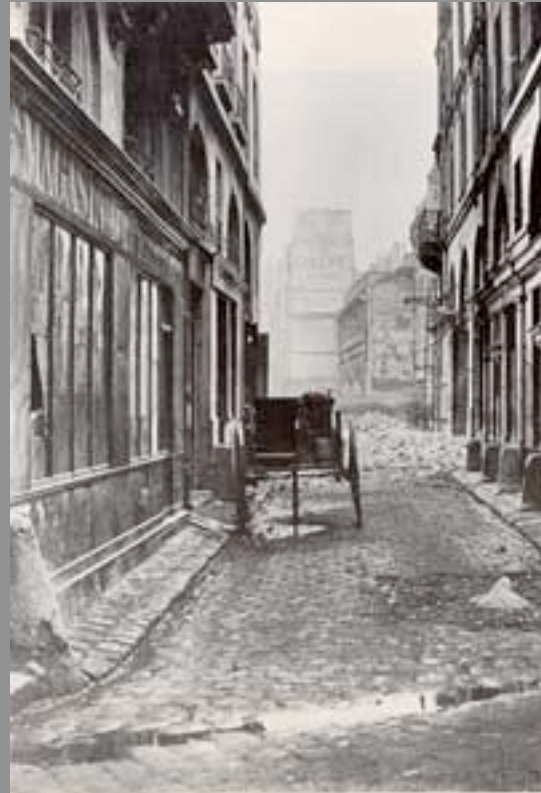
Fig. 1. C. Marseille, Rue Estienne, n. 4.