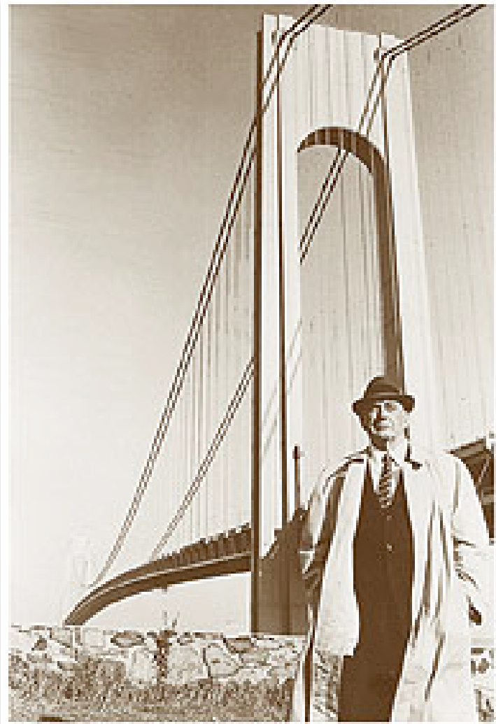
Robert Moses, urban planner