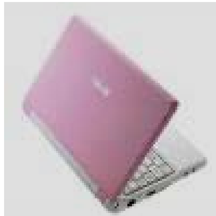
Rikke Sølvsten SUF